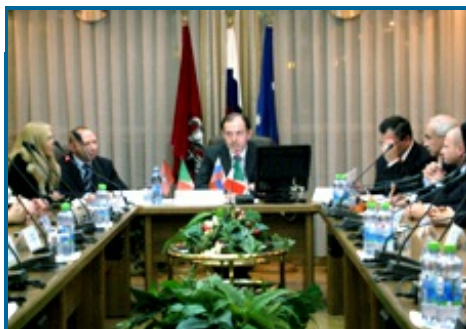
Oleg Mitvol' riceve i delegati della rete scolastica italiana Progetto Russia

Nei giorni trascorsi a Mosca la delega-zione ha avuto modo di visitare, come di consueto, le scuole russe con le quali ormai da sette anni è stato stabilito un proficuo rapporto di collaborazione e >